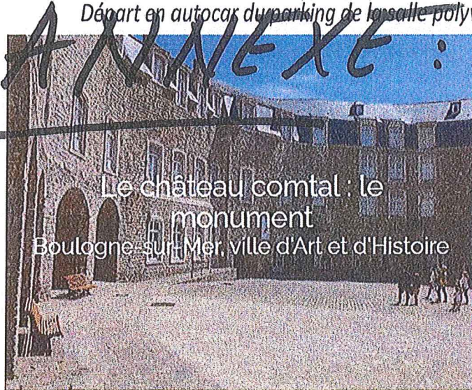
Le château comtal : le monument Boulogne-sur-Mer : ville d'Art et d'Histoire

Départ en autocar du parking de la salle polyvalente à 13h30. Retour sur Coquelles à 18h30