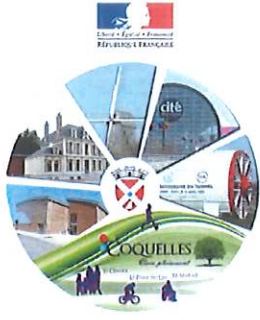
Ville du Tunnel sous la Manche